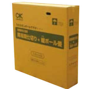
簡易間仕切り+暖ボール畳